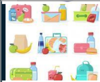
Ланч-бокс і пляшку води