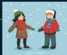
Зимовий одяг, взуття

Крім того, непогано запитати у школі, чи є ще інші речі, які потрібні.