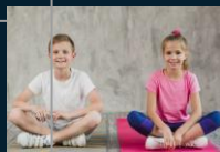
Спортивний одяг, взуття та рушник